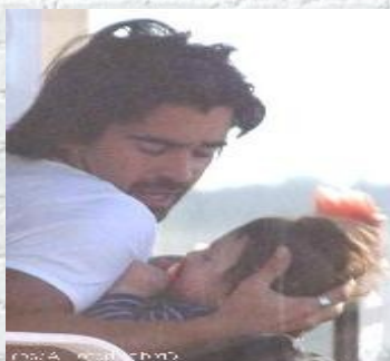
Colin Farrell brise le silence !

Bien que ce syndrome ne soit pas directement associé à l'autisme nous le mettons parmi les autres parce qu'il présente plusieurs caractéristiques identiques et semble provenir de la même cause*.